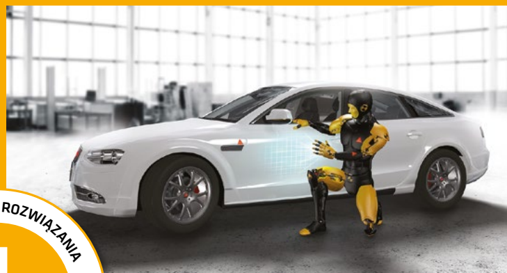
PRZYGOTOWANIE PRZED LAKIEROWANIEM