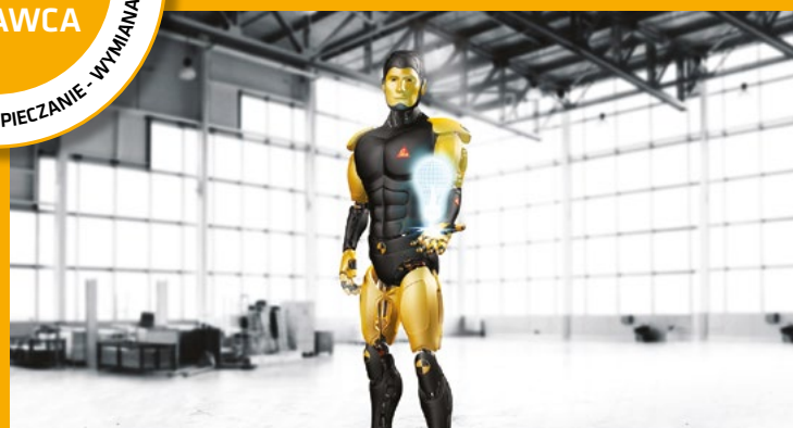
NARZĘDZIA + OSPRZĘT

Informacje, a w szczególności zalecenia dotyczące działania i końcowego zastosowania produktów Sika są podane w dobrej wierze, przy uwzględnieniu aktualnego stanu wiedzy i doświadczenia Sika i odnoszą się do produktów składawanych, przechowywanych i używanych zgodnie z zaleceniami podanymi przez Sika.