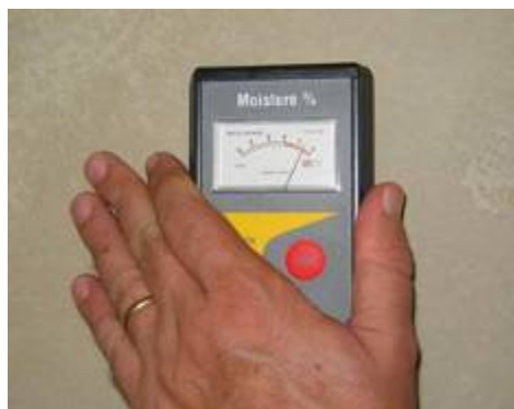
Miernik Sika Tramex

Negatywny wynik badania folią wg ASTM D 4263