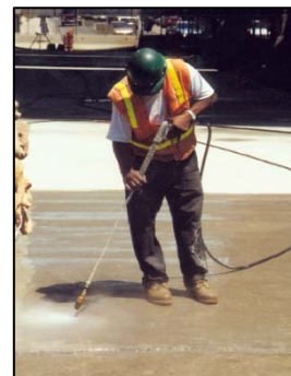
Przygotowanie podłoża: czyszczenie wodą pod wysokim ciśnieniem