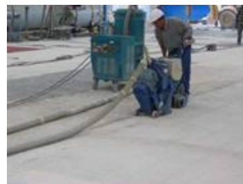
Przygotowanie podłoża: metoda strumieniowo-ścierna lub inna mechaniczna. Np. Blastrac.

Wybór sposobu przygotowania podłoża zależy od stanu podłoża, ograniczeń środowiskowych i możliwości sprzętowych. Metoda musi być wybrana na podstawie efektów oczyszczenia sprawdzonych na polach próbnych i zaakceptowana przez Inwestora.