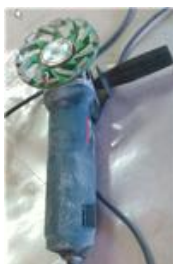
Szlifierka do betonu